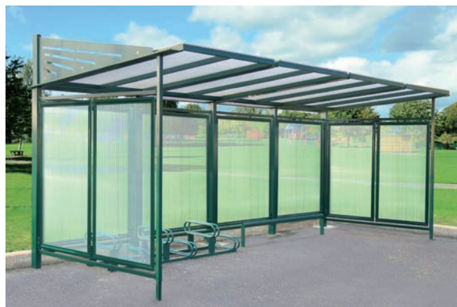
Réf. 529614 + 204105 + 204711